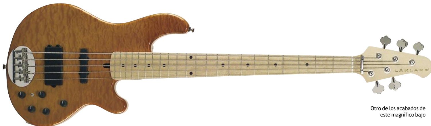
Otro de los acabados de este magnífico bajo

➤ redondeados del diapasón hacen que el ancho del mástil parezca más estrecho al tacto. Hasta cierto punto, no hay nada sorprendente en él, y eso es bueno. No obstante, la baja acción de las cuerdas sí resulta sorprendente, porque el instrumento ofrece un gran volumen sin ningún trasteo: ¡un comportamiento que solo es posible con un trasteado perfecto!