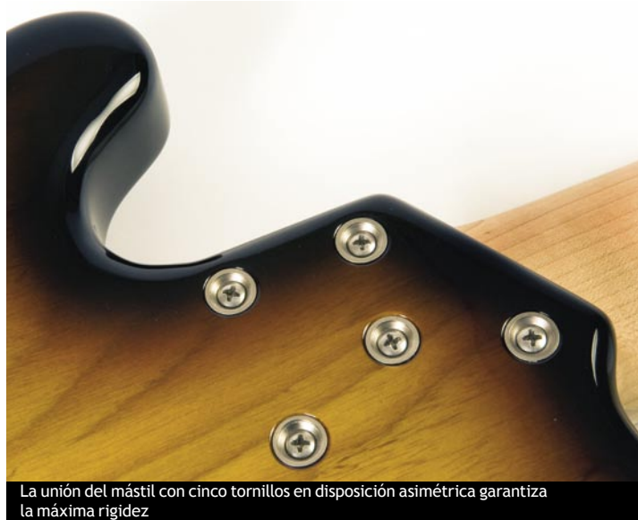
La unión del mástil con cinco tornillos en disposición asimétrica garantiza la máxima rigidez

Bajo su humilde apariencia se esconde uno de los mejores instrumentos que el dinero puede comprar