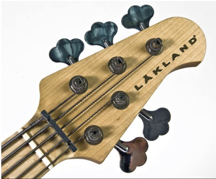
El diseño de la pala, sin inclinación y ligeramente retrasada, requiere un tirador en forma de barra para todas las cuerdas