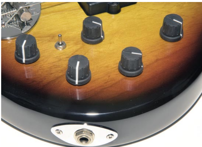
Máxima flexibilidad tímbrica, el conmutador mini-toggle permite tres selecciones de bobinas sobre la pastilla MM

que hay al final del puente, y los sujetas correas Dunlop se pueden usar con straplocks o con una bandolera normal.